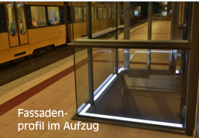
Fassaden- profil im Aufzug

Konturbeleuchtung Handläufe | Spiegel Ecken | Winkel