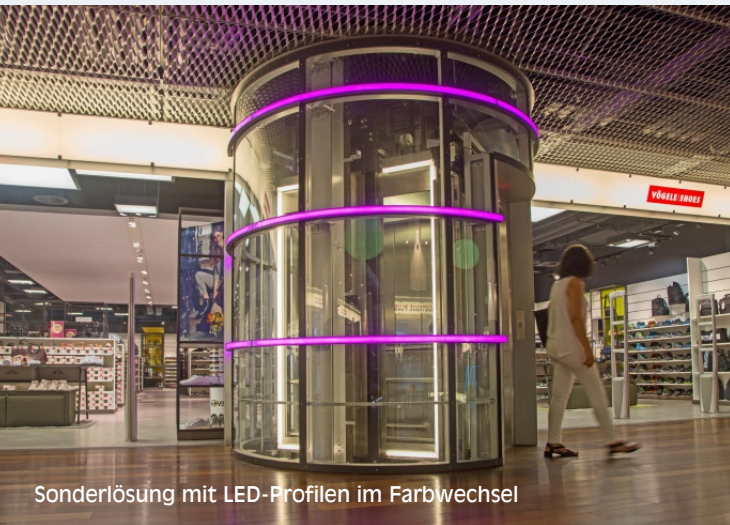
Sonderlösung mit LED-Profilen im Farbwechsel

Orientierungslicht | Schachtbeleuchtung indirektes Licht | Licht nach Maß