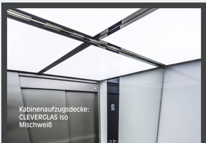
Kabinenaufzugsdecke: CLEVERGLAS iso Mischweiß