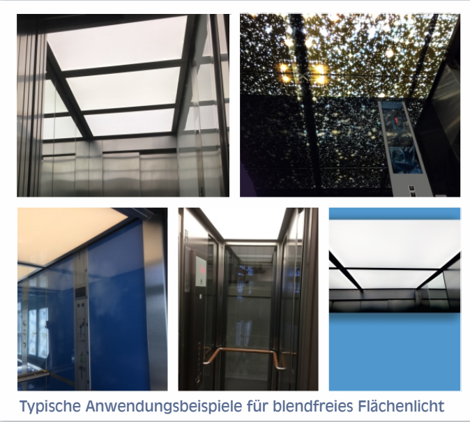
Typische Anwendungsbeispiele für blendfreies Flächenlicht

Mit einem kompetenten Team von 85 Mitarbeitern findet die komplette Wertschöpfung und Produktion seit 1984 in Haselund, Nordfriesland statt.