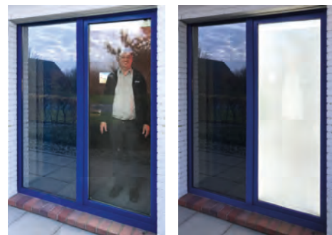
SICHTSCHUTZ CLEVERGLAS ISO als Sichtschutz auf Abruf.