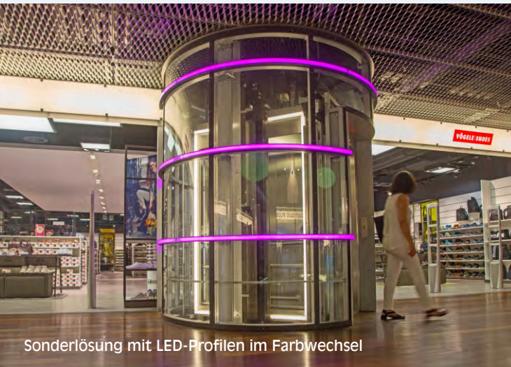
Sonderlösung mit LED-Profilen im Farbwechsel

Orientierungslicht | Schachtbeleuchtung indirektes Licht | Licht nach Maß