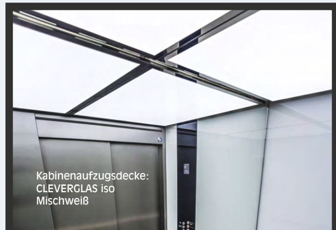
Kabinenaufzugsdecke: CLEVERGLAS iso Mischweiß