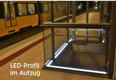
LED-Profil im Aufzug

Konturbeleuchtung Handläufe | Spiegel Ecken | Winkel