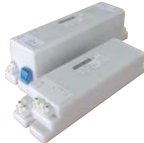
Einbau - Konstantstromtrafo