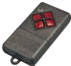
Handsender Reichweite: 20....50 m