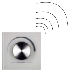
Sender „2805R“ als Wandeinbau-Sender