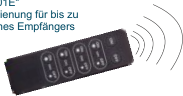
Sender „2801E“ als Fernbedienung für bis zu 4 Kanäle eines Empfängers