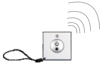
Sender „2807S“ als Taschen-Fernbedienung