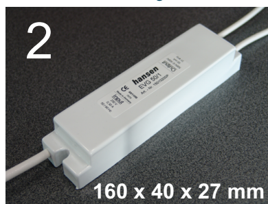
Gehäusefarbe: weiß Abmessungen in Millimeter