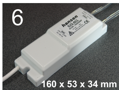
Gehäusefarbe: weiß Abmessungen in Millimeter