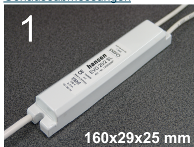
Gehäusefarbe: weiß Abmessungen in Millimeter